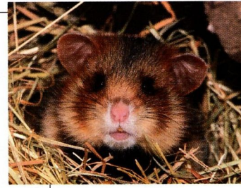
Lotti im Stroh 3