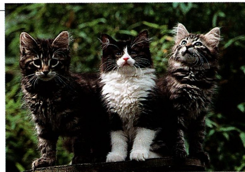
Meine Katzen als Babys